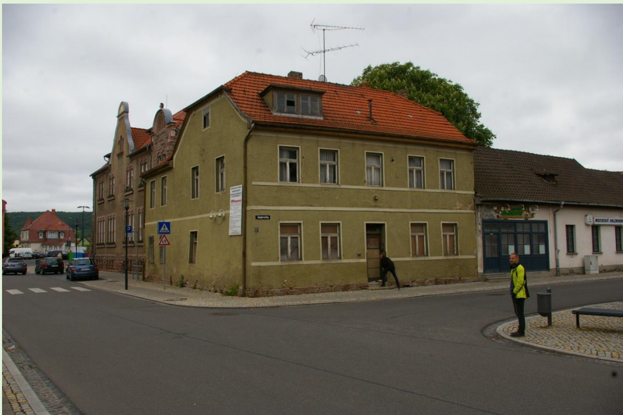
Ansicht, Oktober 2016