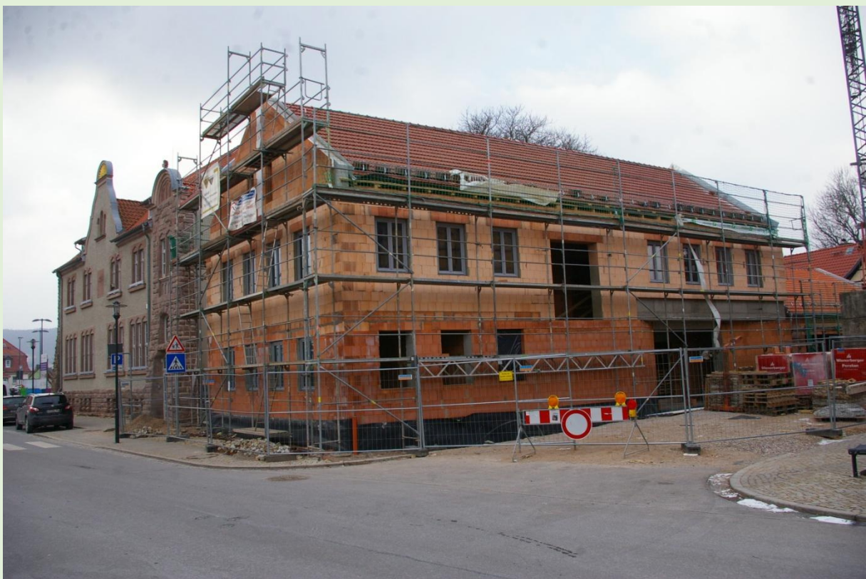
Ansicht nach Rohbaufertigstellung , Februar 2018