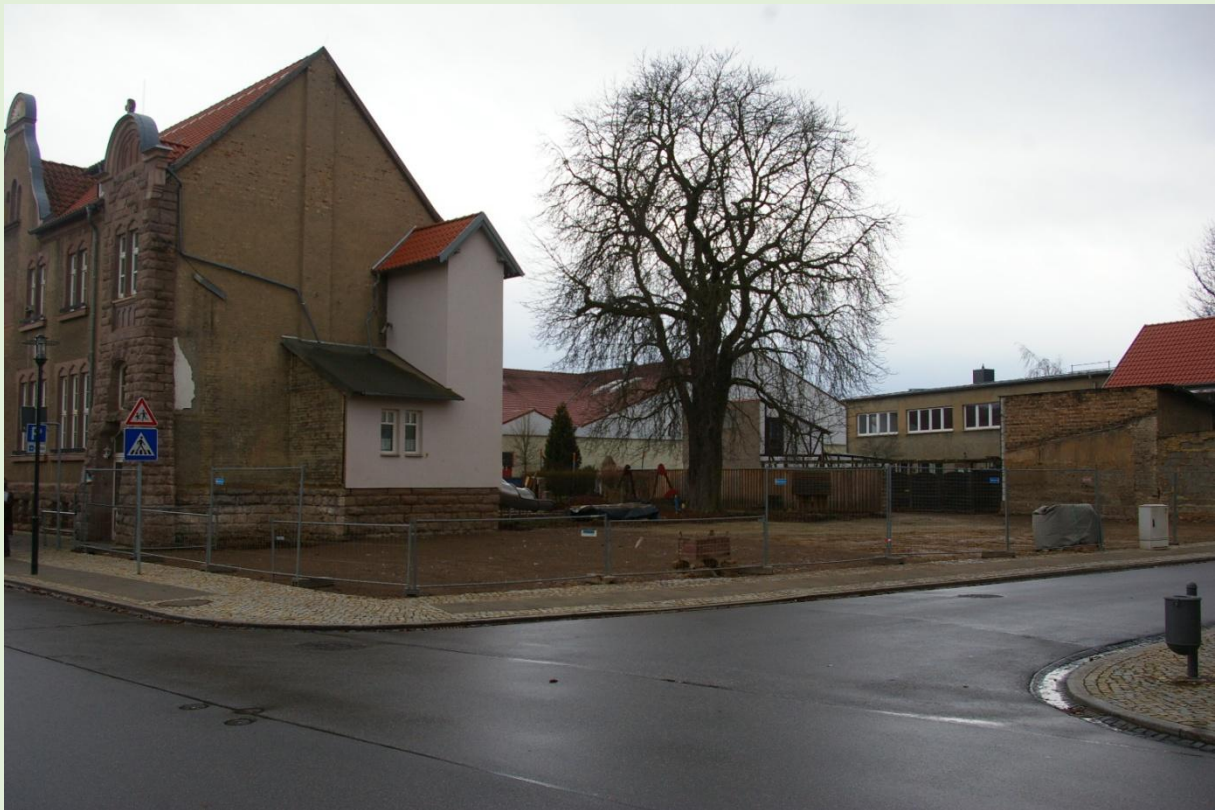
Ansicht nach Rückbau , Februar 2017