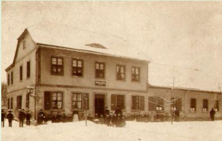
Kinderbewahranstalt um 1895

Am 5. Februar 1847 wurde das Gebäude seiner Nutzung übergeben. Wenn Martini bei allen Überlegungen von 20 Kindern ausgegangen ist, waren ständig 60 – 80 und in Ausnahmefällen sogar 112 Kinder untergebracht.